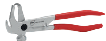
Pinza para contrapesos Cód. 90695 391 885