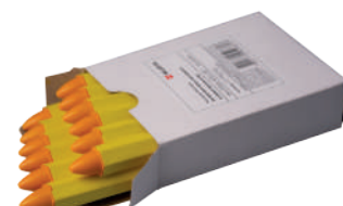
Marcador amarillo de cera Cód. 90984 400 081