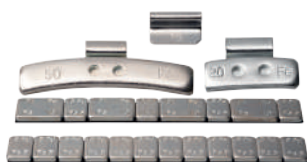
Contrapesos familia completa