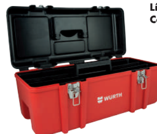
Caja herramientas polipropileno nro 2 y nro 3 Cód. 90962 219 ...