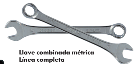
Llave combinada métrica Línea completa Cód. 90713 301 ...