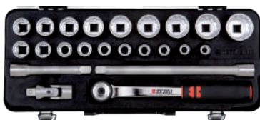
Set de tubos multiuso encastre 1/4" - 32 pz. Cód. 90965 11 032