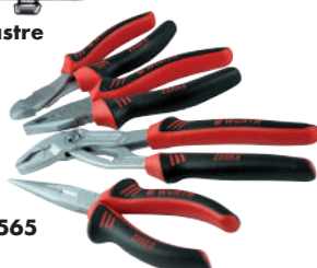
Set de pinzas Zebra - 4 pz. Cód. 90714 01 565