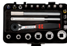
Set de tubos de 1/4" multiuso - 23 pz. Cód. 90965 11 23