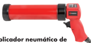
Aplicador neumático de selladores 310ml Cód. 90703 891 020