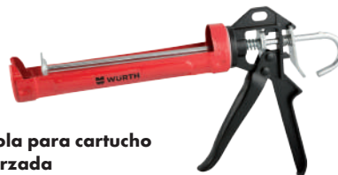
Pistola para cartucho reforzada Cód. 90891 320 101