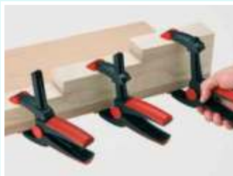
Operable con una mano, incluso con grandes anchos de agarre.