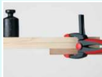
Máxima fuerza de agarre en cada posición.